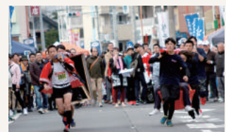
昨年の早かごレースの様子