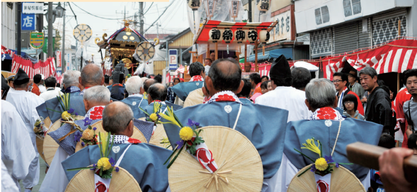
平成28年の秋祭りの様子