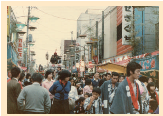
昭和58年の秋祭りの様子